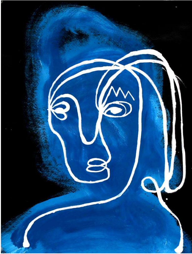
By Salen Y

chaminés/técnicos e pedreiros certificados. Trabalhamos com inspeções contínuas e manutenção de chaminés, condutas de aquecimento e secadores para garantir que nossas casas estejam seguras. Além disso, nós reparamos alvenaria, reconstruímos chaminés e lareiras, bem como trabalhamos junto com encanadores locais e empresas de aquecimento.